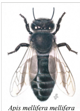
Apis mellifera mellifera (Aquarell Maria Mizzaro)

Unter «lokal angepasste Bienen» versteht man seit mehreren Jahren wild lebende mischrassige Bienen, die der natürlichen Auslese ausgesetzt, und ohne Einmischung des Menschen in dem Lebensraum überleben können, den sie spontan ausgewählt haben. Diese lokal angepassten, aus der natürlichen Auslese entstandenen Stämme können nur in Gebieten dauerhaft auftreten, in denen die Dichte der Bienenvölker gering und die Auswirkungen der Bienenzucht unbedeutend sind (Albouy, pers. Mitt., 2020) (Shaw, 2015). Die lokale Prägung findet dort statt wo die Befruchtung erfolgt, d.h. an den Versammlungsplätzen der Drohnen. Sie hängt nicht von der Gebietsgröße sondern von der Topografie ab. Zum Beispiel kann ein Gebiet wegen der umliegenden bewaldeten und landwirtschaftlichen Flächen ausgesprochen isoliert sein. Im Vereinigten Königreich haben sich unterschiedliche Stämme der Apis mellifera mellifera , «Dunkle Biene» genannt, in einem Abstand von weniger als 30 km von einander entwickelt. Die wild lebende Dunkle Biene ist vermutlich nicht mehr in Luxemburg vorhanden.