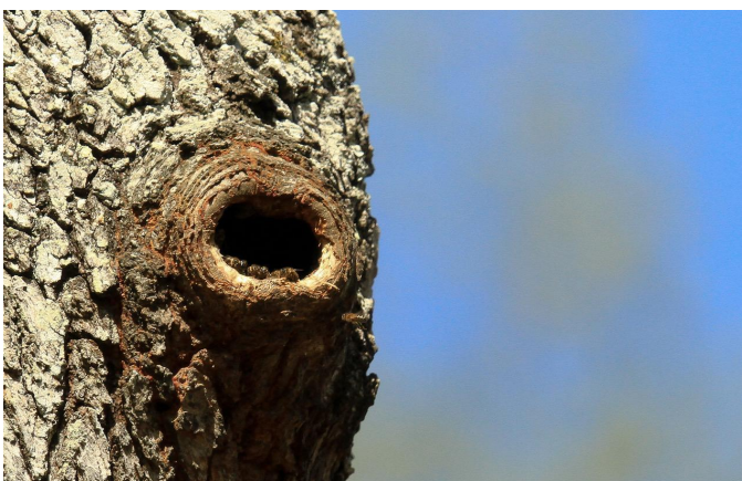
Von Bienen besetzte Buntspechthöhle in einer Eiche im Staatswald von Loches in der Touraine, Frankreich

Es ist die Freude an der Beobachtung der Natur und an Spaziergängen im Wald, die uns dazu bewogen hat, unser Citizen science - Projekt mit der Untersuchung der Besetzung von Spechthöhlen durch Bienen zu ergänzen, in Partnerschaft mit der zentralen luxemburgischen Vogelschutzbehörde (COL) und in Absprache mit dem Waldreferat der Natur- und Forstbehörde (ANF) in Luxemburg.