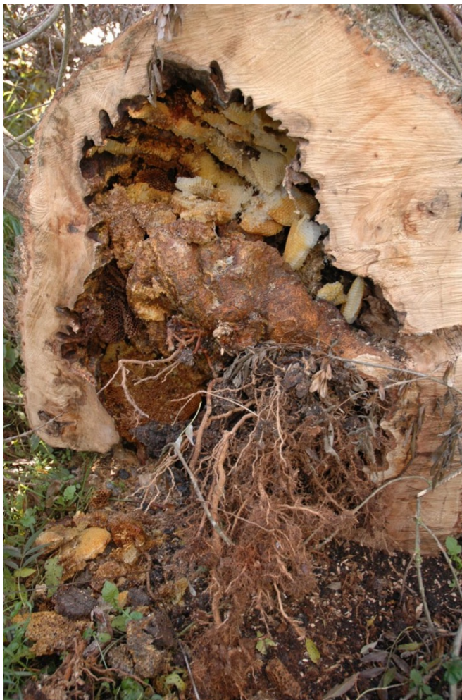
Dieser leider umgesägte Kopfbaum beherbergte ein Bienennest im Cher-Tal des Loir-et-Cher Gebietes.

Das häufige Zurückschneiden von Kopf- und Straßenbäumen verursacht Verletzungen und infolgedessen ein Ausfaulen des Stamminnern durch Pilze, wodurch dann recht schnell Hohlräume entstehen. Der Kopfbaum ist von großem Interesse, denn er beherbergt zahlreiche Arten und seine Funktionen sind vielfältig: Er ist das "Schweizer Taschenmesser" der Agroforstwirtschaft (Mansion, 2019)(Mériguet, 2021). Heckenlandschaften mit zahlreichen Kopfbäumen bilden einen halb-natürlichen Lebensraum, in dem wild lebende Bienenvölker häufig Hohlbäume besiedeln. In einigen Waldgebieten wurden Schläge durch Kopfbäume abgegrenzt. Straßenbäume sind ebenfalls für wild lebende Bienenvölker nützlich, wie eine polnische Studie bei Linden festgestellt hat (Albouy, pers. Mitteilung).